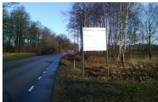
Kommuninformation vid infartsväg