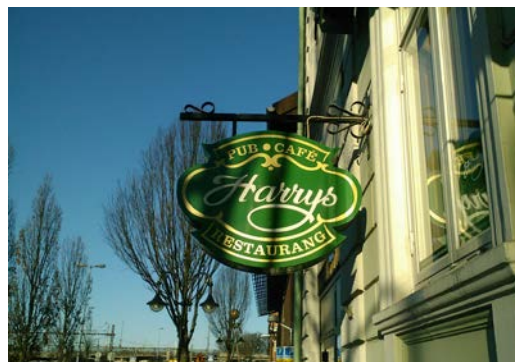
Invändigt belyst flaggskylt