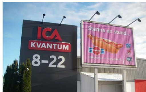
Exempel på bildväxlande skylt

Hänvisningsskyltar till enskilda företag eller inrättningar tillåts endast om behovet inte kan lösas med skylt på aktuell fastighet eller med gemensamma orienteringstavlor för ett större verksamhetsområde. För mer information om hänvisningsskyltar kontakta tekniska avdelningen.