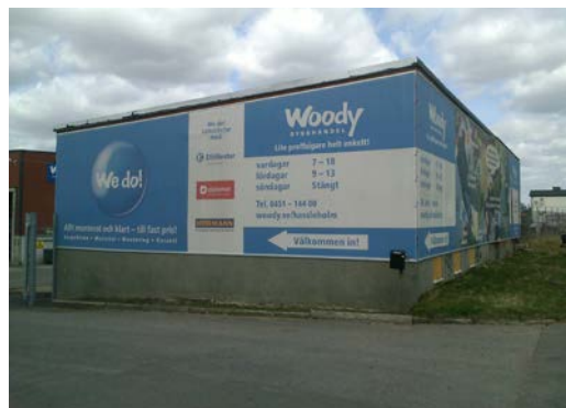
Tillfällig vepa, lovpliktig