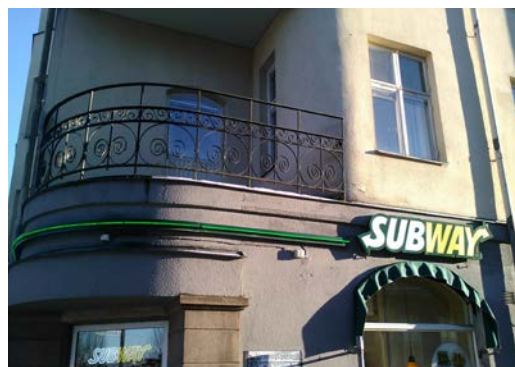
Sammanhängande markering med neonrör

Även vepor och banderoller räknas som skylt och är bygglovspliktiga inom detaljplan. Då dessa har en tillfällig karaktär ska endast tidsbegränsade bygglov ges. Denna typ av skylt används oftast vid tillfälliga kampanjer och då gäller att upp till 10 dagar kan den sättas upp utan bygglov. Är avsikten att den ska sitta uppe i mer än 10 dagar så måste bygglov beviljas och startbesked ges innan skylten sätts upp. Tänk på att tillstånd från fastighetsägaren alltid krävs.