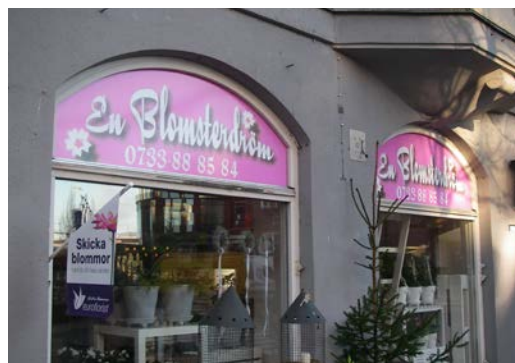
Fönsterdekalers istället för fasadskylt