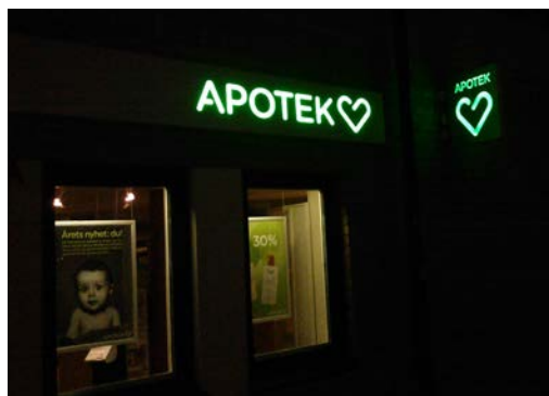
Invändigt belyst skylt