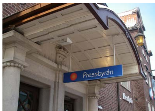
Skylt med liten påverkan på byggnadens karaktär