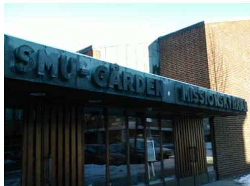
Skylt och fasad utgör en arkitektonisk helhet

Vid infartsvägar till tätbebyggt område ska reklamskyltar undvikas till förmån för kommuninformation. Ur trafiksäkerhetssynpunkt är det olämpligt med braskande reklam som lätt avleder uppmärksamheten från trafiken. Skyltar i trafikmiljö ska vara enhetligt utformade, informativa och vägleda kommunens besökare. Mindre skyltning på exempelvis busskurer kan tillåtas om det bedöms kunna göras utan men för trafiksäkerheten.